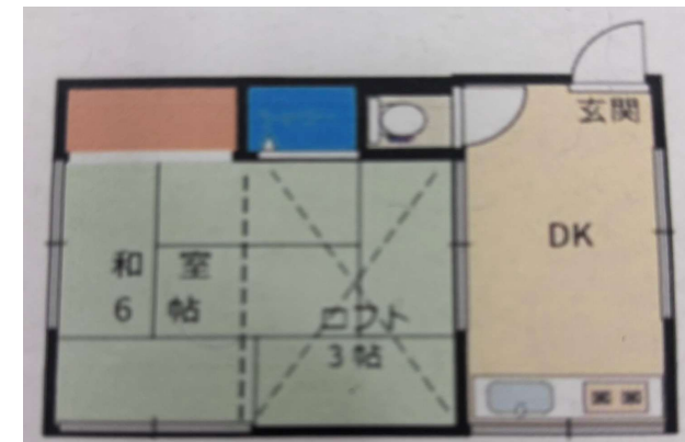
図面と現況が異なる場合は、現状優先します。現況優先とします。